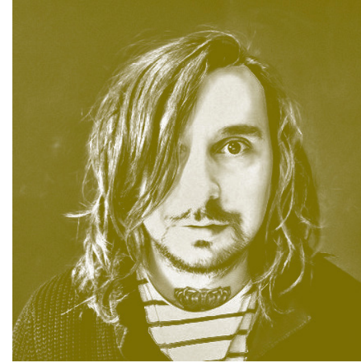
EDY PONS MÚSIC